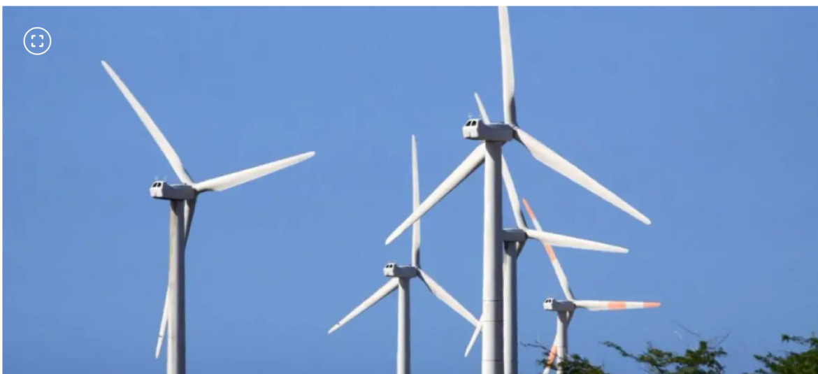
Parque eólico.

Expertos cuestionan si la petrolera heredó un proyecto con fallas irremediables. Ministerio confía en reactivación.