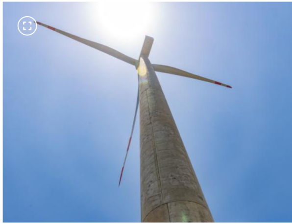
Parque eólico