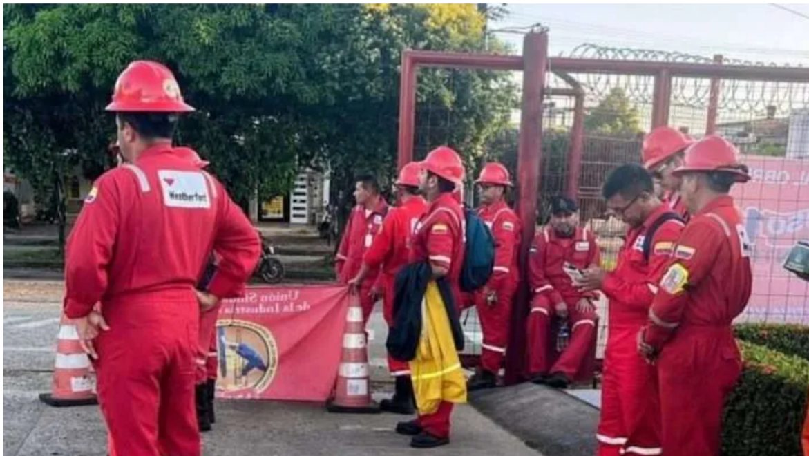
La Unión Sindical Obrera, USO, es el principal sindicato de Ecopetrol .