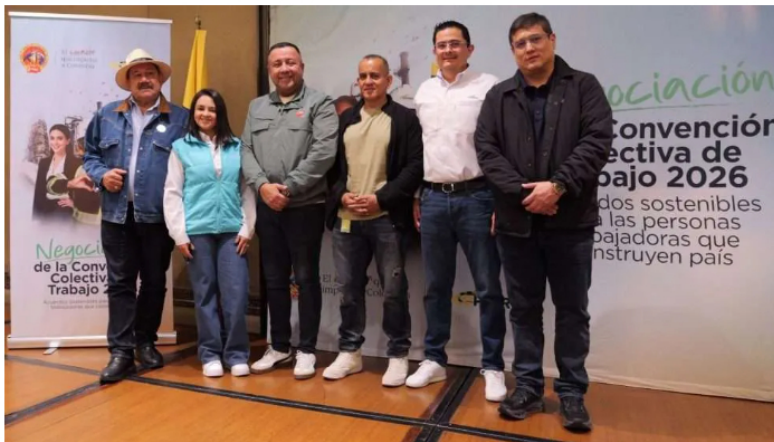
Directivos de la USO

Únase AQUÍ a nuestro WHATSAPP | TIK TOK | INSTAGRAM