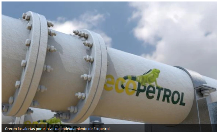
Crecen las alertas por el nivel de endeudamiento de Ecopetrol.

Bogotá – La situación financiera de Ecopetrol vuelve a encender las alarmas en el sector energético. Un análisis reciente del indicador Debt-to-Value revela que la compañía colombiana es actualmente la más endeudada entre 12 de las principales petroleras del mundo, con un nivel cercano al 50% de su valor en bolsa financiado con deuda.