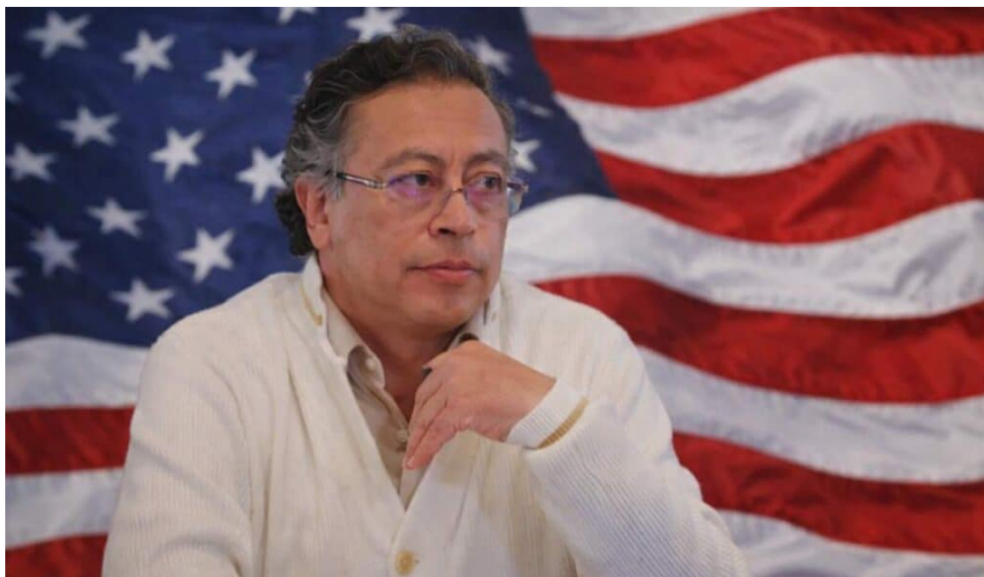
Gustavo Petro, presidente de Colombia.

El agravante adicional es que el presidente colombiano está incluido en la denominada Lista Clinton desde octubre de 2025 y, por esas restricciones, no debería intervenir en ningún aspecto directivo de Ecopetrol cuyas acciones –a través de ADR– está listada en la Bolsa de Valores de Nueva York.