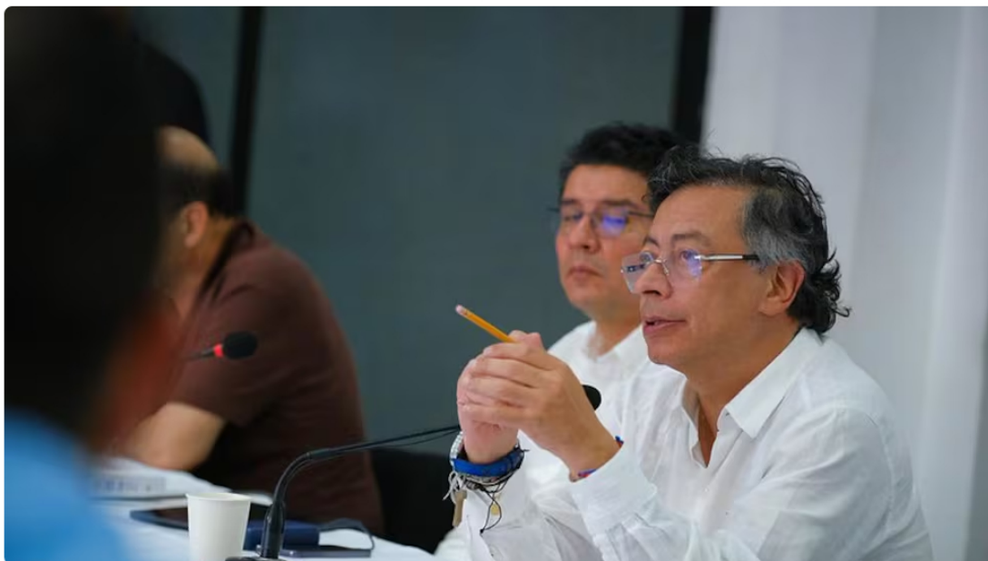
El presidente Gustavo Petro sorprendió en sus redes sociales por supuesto plan de sus contradictores sobre Ecopetrol .

Este miércoles 1 de abril, el presidente de la República, Gustavo Petro, puso sobre la mesa un supuesto plan que tiene la oposición sobre la que considera la joya de la corona de Colombia: Ecopetrol , compañía que está en el ojo del huracán por los líos judiciales que tiene su presidente.