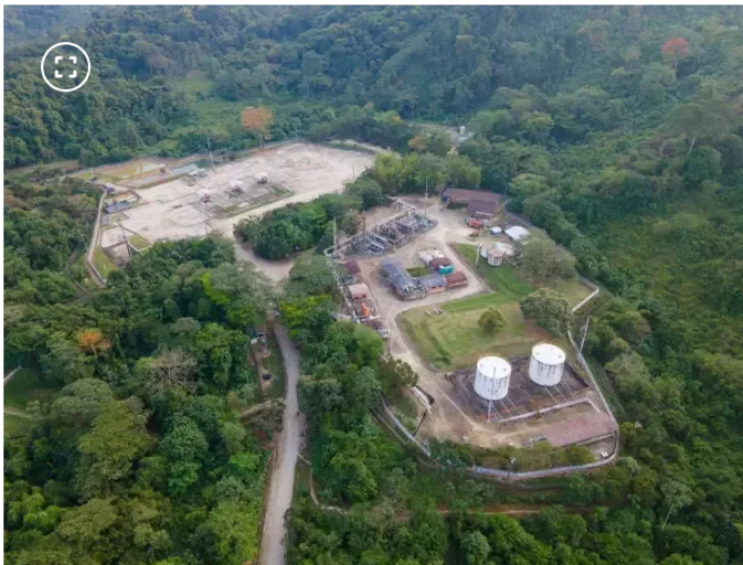
Planta de gas Gibraltar

La empresa estatal indicó que la transición se realizó a partir del vencimiento contractual, sin interrupciones en la operación. La infraestructura continúa funcionando bajo los mismos parámetros técnicos que garantizan la continuidad del servicio.