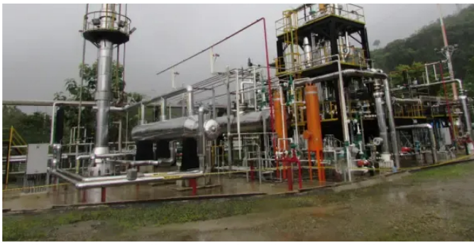
Planta de gas Gibraltar

Con la operación directa, Ecopetrol asume también la gestión técnica, el mantenimiento y la administración de la infraestructura, alineándola con los estándares aplicados en otros activos de su red de producción de gas.