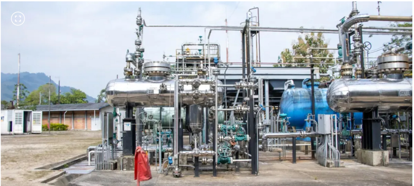
Planta de gas Gibraltar

La estatal petrolera tomó control de la infraestructura tras 15 años de operación privada.