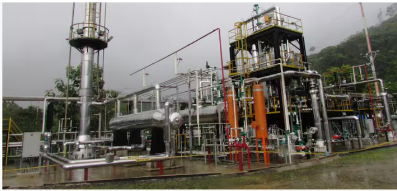
Planta de gas del campo Gibraltar de Ecopetrol.