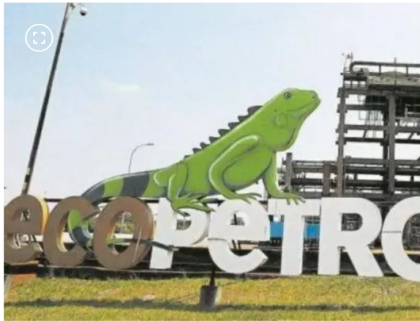
Dos miembros rechazan reunirse con el presidente Petro.

Esa instancia adicional será un encuentro a puerta cerrada con el presidente Petro, cuya invitación fue extendida a los nueve miembros de la junta. Fuentes confirmaron que la cita se programó inicialmente para el lunes 6 de abril, aunque su realización aún está sujeta a confirmación, con el objetivo de que el mandatario exponga su punto de vista antes de que el órgano directivo adopte una decisión definitiva.