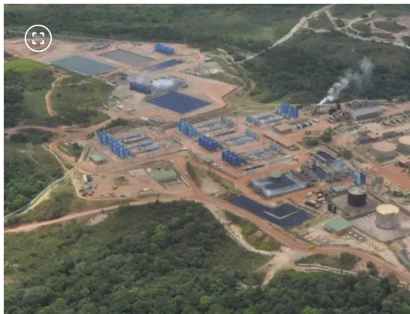
Dos miembros rechazan reunirse con el presidente Petro.

El mandatario también se refirió al proceso por presuntos excesos en los topes de campaña, afirmando que “a mí me quieren coger preso con el proceso en Fiscalía contra Roa por sobre topes porque un sindicato de trabajadores del petróleo intentó dar aportes y nosotros lo rechazamos ”; poniendo sobre la mesa un componente político adicional a la discusión que enfrenta la junta directiva.