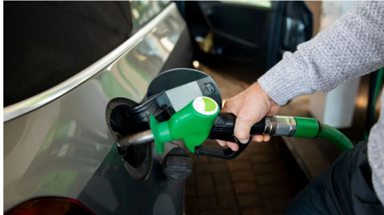
Precio de la gasolina bajará de precio en febrero.

La distribuidora de combustibles Organización Terpel firmó un nuevo contrato con la petrolera estatal Ecopetrol por cerca de $10 billones para el suministro de gasolina y diésel en el país . El acuerdo comenzará a regir desde abril y se ejecutará de forma progresiva.