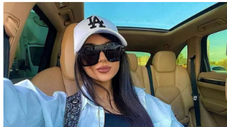
Bitcoin Bank De empleada bancaria a la mujer más rica de Chia