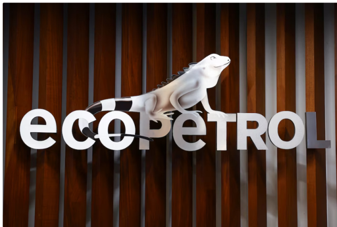
La junta directiva de Ecopetrol aplazó la decisión sobre su presidencia y convocó una reunión clave con el presidente Gustavo Petro en la Casa de Nariño