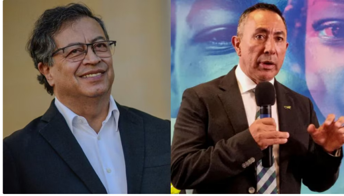
El presidente de Ecopetrol, Ricardo Roa, junto al mandatario Gustavo Petro, en medio de la controversia por su continuidad al frente de la petrolera

Según la Fiscalía General de la Nación, los aportes habrían superado los topes legales en más de 5.300 millones de pesos.