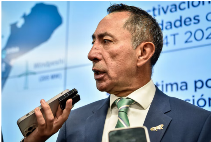
La Unión Sindical Obrera (USO) ha expresado preocupaciones sobre el impacto reputacional y la gobernanza de Ecopetrol en medio de la crisis directiva