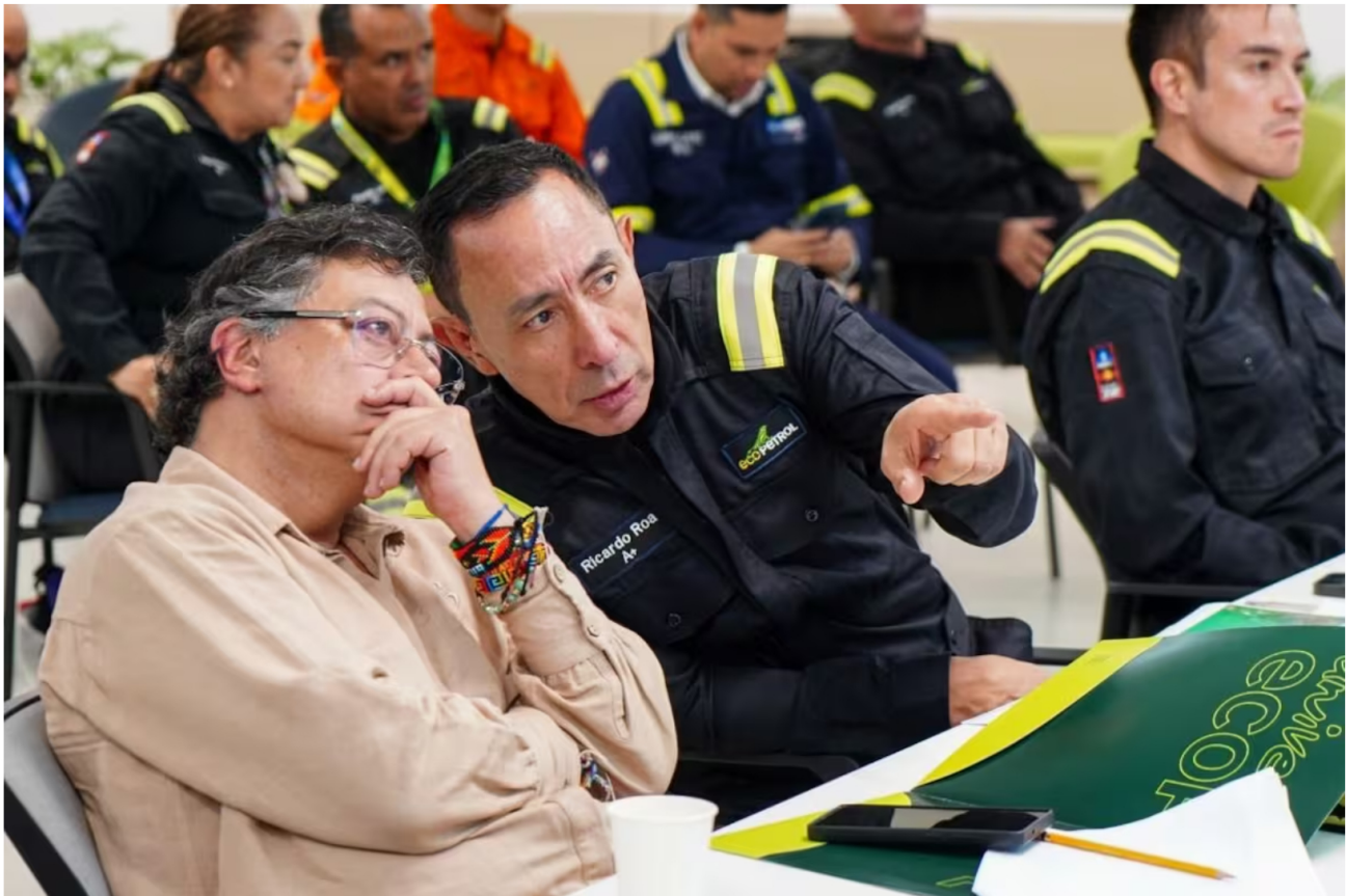
Petro insiste en respaldo a Ricardo Roa como presidente de Ecopetrol.

Siga las noticias de El Universal en Google Discover