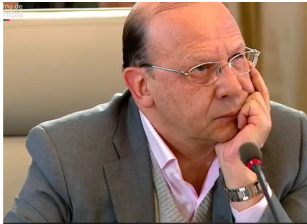
El retiro del Gobierno de la junta del Banco intensificó el debate sobre la independencia de las instituciones económicas.

El retiro sin precedentes del Gobierno del órgano director del banco reavivó críticas por su actuar en juntas, al compararse con Ecopetrol donde sí respalda decisiones al tener mayorías y pide respeto.