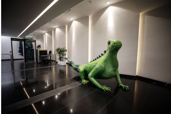
Ecopetrol se debate entre el repunte de su acción y su crisis reputacional a dos meses de elecciones. La sede de Ecopetrol SA en Bogotá, Colombia, el lunes 24 de abril de 2023.

La acción de la petrolera estatal colombiana ha subido más de 20% en marzo y el mercado espera que dé más utilidades en el primer trimestre de 2026 tras el desplome de ganancias en 2025.