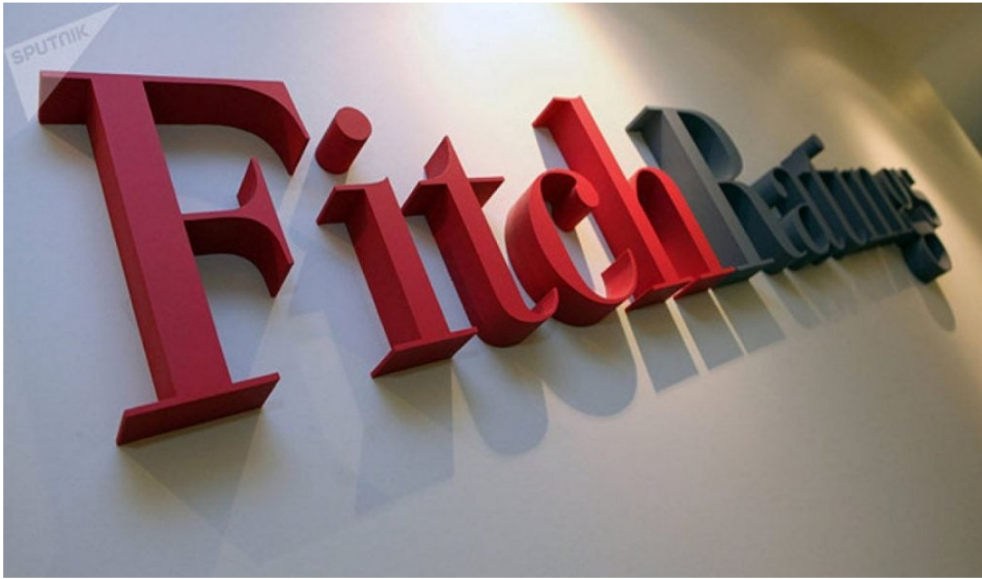
Sede de Fitch Ratings

Relacionado: Primicia | Ecopetrol proyecta rebote en ganancias para el tercer trimestre de 2025.