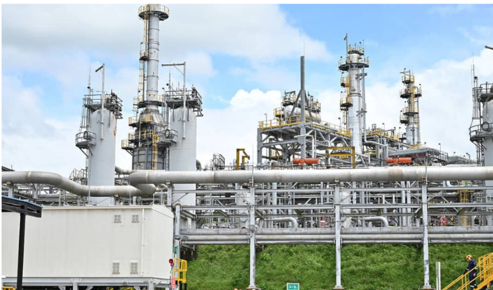
Cupiagua, Ecopetrol .

En términos de resultados operativos, Fitch proyecta una producción total de hidrocarburos de cerca de 744.000 barriles de petróleo equivalente (bpe) por día en 2025, cifra similar a 2024, con mayor producción de crudo compensando la producción menor de gas.