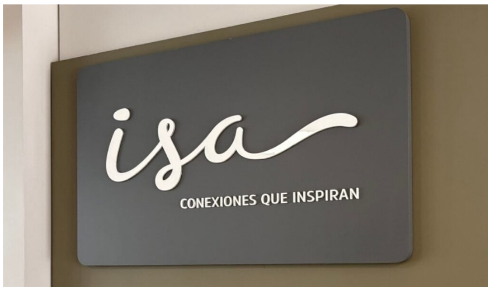
Interconexión Eléctrica (ISA).

Además, Fitch estima que Ecopetrol podrá refinanciar, parcial o completamente, los vencimientos de 2026 y 2027.