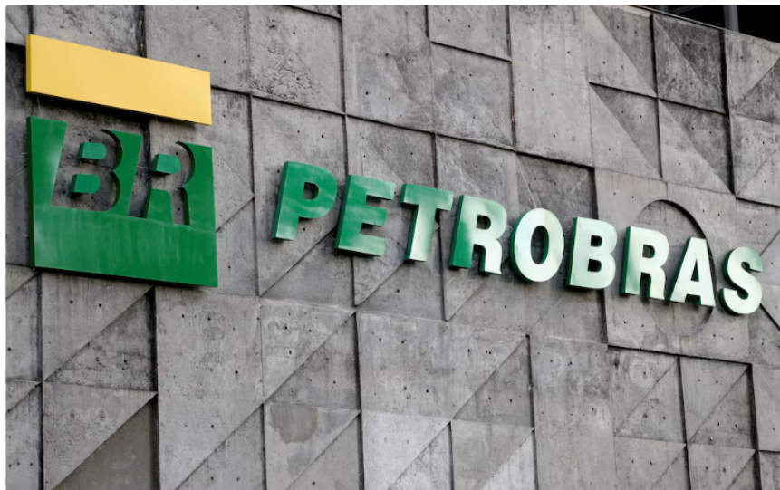
FOTO DE ARCHIVO: Logo de la petrolera estatal brasileña Petrobras en su sede en Río de Janeiro, Brasil Octubre 16, 2019.