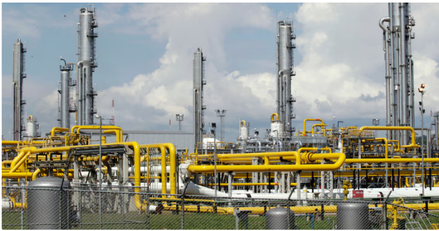
Foto de archivo. Planta de Gas natural

Ahora puede seguirnos en nuestro WhatsApp Channel y en Facebook