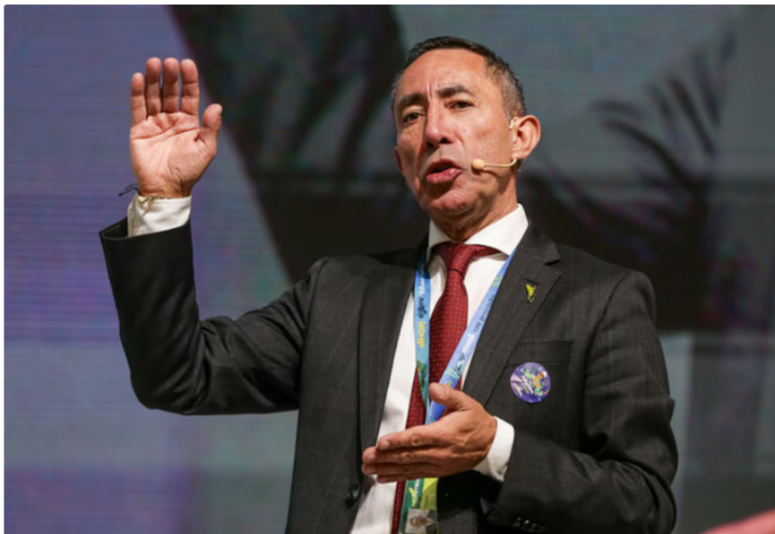
Ricardo Roa es el presidente de Ecopetrol

El presidente de Ecopetrol , Ricardo Roa, destacó el carácter estratégico de la alianza y su impacto en el mercado energético colombiano. "Quiere decir que dos grandes actores como lo son Petrobras y el grupo Ecopetrol se unen para atender a sus clientes. Dos empresas, grandes compañías en América Latina, hacen una alianza en la que hoy van a poner a disposición del mercado y de la industria, quizás las más grandes de los recursos firmes para los años entre el 2030 y el 2035 ", afirmó durante la presentación del acuerdo.