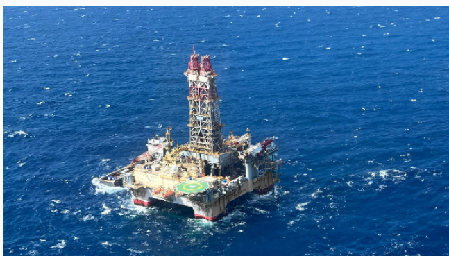
El pozo Sirius-2, ubicado en aguas profundas frente al litoral de Santa Marta, es operado por Petrobras y tiene un carácter evaluador.

Narciso De la Hoz G. | octubre 30, 2025 @ 4:51:53 pm