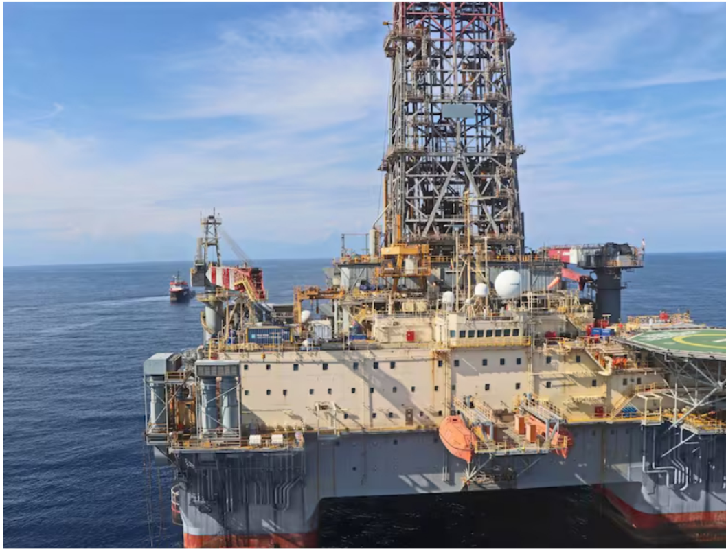
Pozo Sirius-2 en el Caribe colombiano. Ecopetrol

El gas que se va a comercializar tendrá una reducción para los consumidores del 40% frente al importado