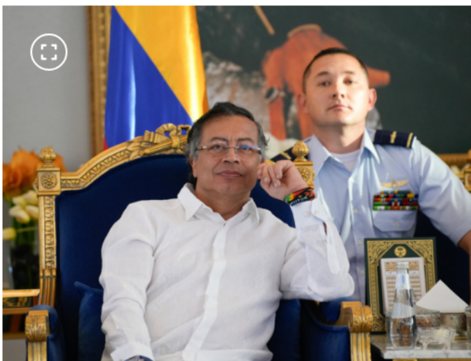
Presidente Gustavo Petro en Riad, Arabia Saudita.

Así se elegirá al trabajador que entrará a junta directiva de Ecopetrol; habrá cambios para recuperar su poder de decisión