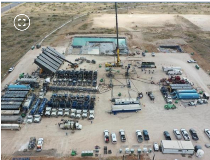
Operaciones de fracking de Ecopetrol en Estados Unidos.

¿Por qué la gasolina sigue subiendo en Colombia si hace 2 años superó el precio internacional? Cada mes los conductores pagan $620.000 millones de más