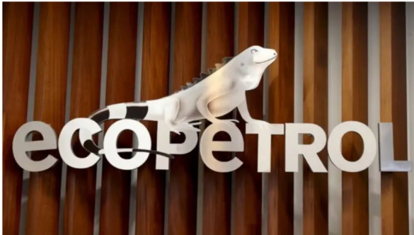
Alcalde de Sutamarchán pide al Gobierno suspender operación de planta de Ecopetrol

Según la alcaldía, se está reduciendo drásticamente la seguridad en la operación de la planta por cuenta de la reducción del personal operativo.