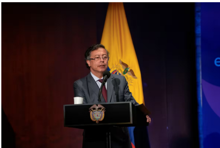
Petro ordena la salida de alto directivo de Ecopetrol.

Compartir Publicado por: Redacción Nacional