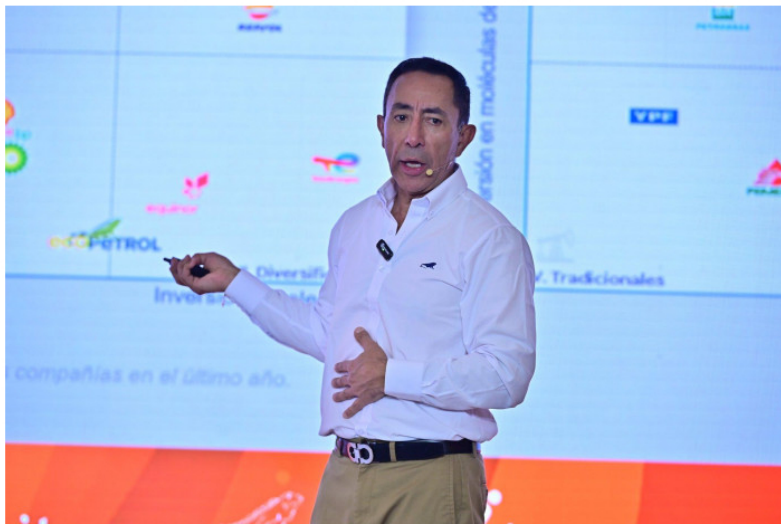
Roa expresó que se