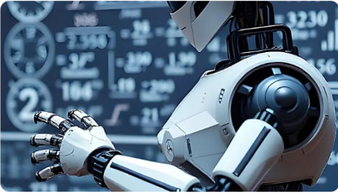
La IA que hace dinero: ¿por qué está causando tanto ruido en la web?

Inversión con IA cfd para colombianos: aprovecha esta gran oportunidad.