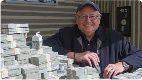
Mercado Libre CFD: gana hasta 2.700$ a la semana trabajando desde casa