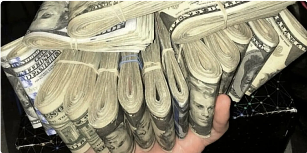
Mercado Libre CFD: gana hasta 5.700$ a la semana trabajando desde casa