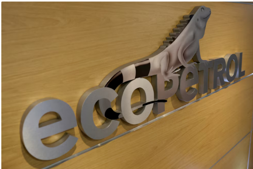
FOTO DE ARCHIVO: Logo de Ecopetrol en su sede en Bogotá, Colombia, 13 de noviembre 2025.