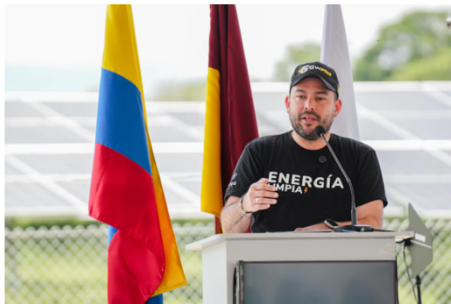
Entre los nombres incluidos figura el actual ministro de Minas y exmiembro de la junta directiva de la petrolera, Edwin Palma.