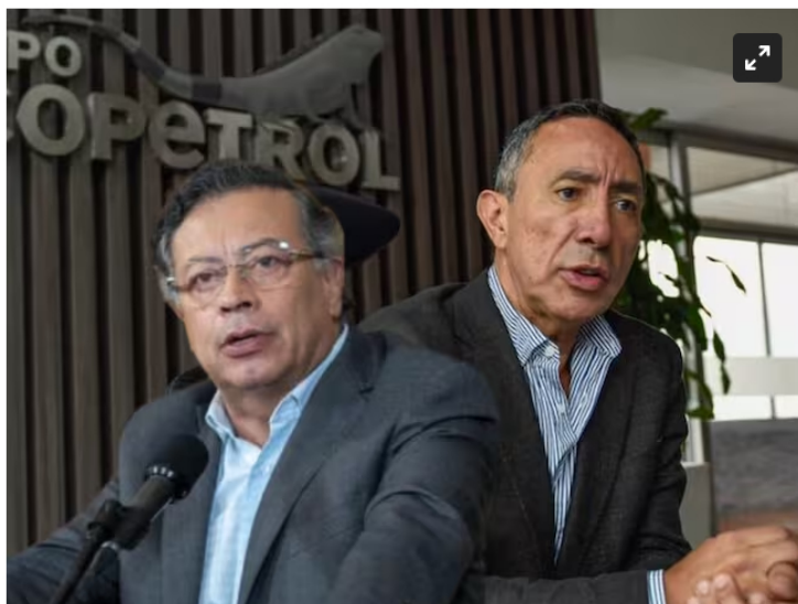
Gustavo Petro y Ricardo Roa

El presidente de Ecopetrol , Ricardo Roa, aseguró que, tras imponer el recurso de apelación, la decisión "no podrá ser diferente a absolvernos de todos los cargos o a declarar la caducidad"