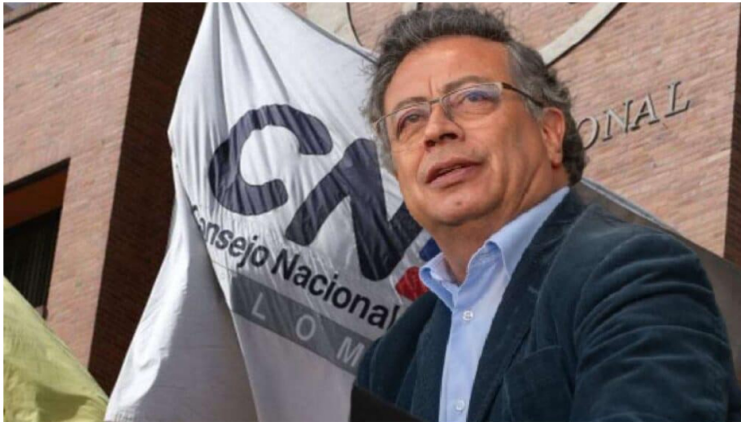
El presidente Gustavo Petro frente al CNE.