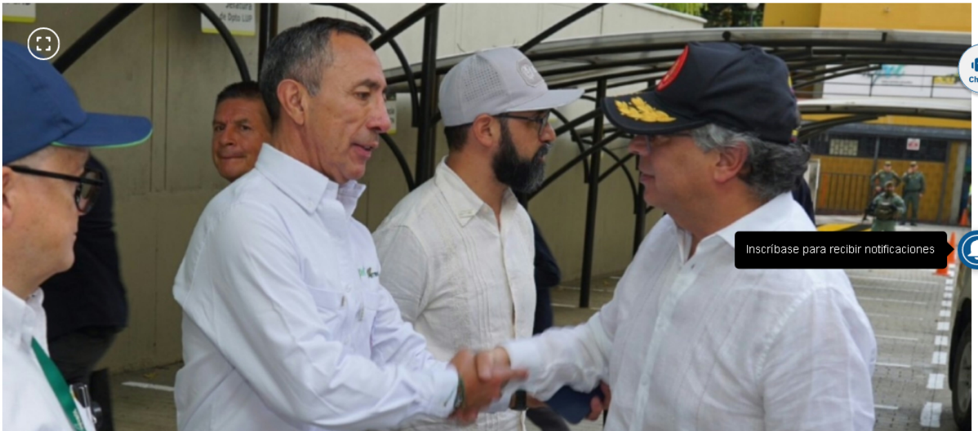
Ricardo Roa y el presidente Gustavo Petro.

Roa fue el gerente de la campaña presidencial de 2022 y será investigado por la Fiscalía. Oposición pide su salida del cargo.