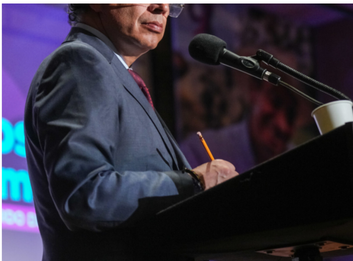
El presidente Gustavo Petro.