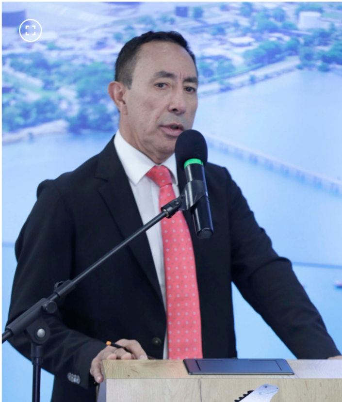
Ricardo Roa

Según el tribunal electoral, la campaña del hoy jefe de Estado superó los toques de gastos de campaña por 5.300 millones de pesos. No reportaron 3.700 millones en la primera vuelta y 1.600 millones para la segunda vuelta.