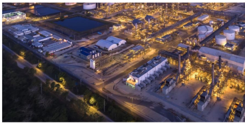
Refinería de Cartagena (Reficar)

En cuanto a Interconexión Eléctrica S.A. (ISA), filial del Grupo, invertirá entre 6,2 y 6,8 billones de pesos en 2026, lo que representa cerca del 26% del presupuesto anual. El 80 por ciento se destinará al negocio de transmisión eléctrica.