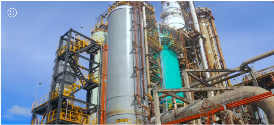
Planta UOP II de la refinería de Barrancabermeja.

El plan contempla que el 70 % del presupuesto se dirija a la línea de hidrocarburos, con producción entre 730.000 y 740.000 barriles equivalentes.