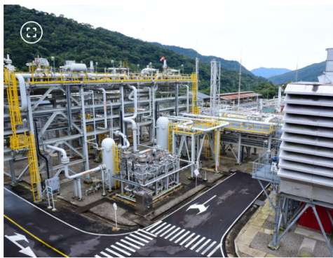
Campo Floreña de Ecopetrol

La organización proyecta ejecutar cerca de 1,7 billones de pesos en iniciativas relacionadas con asuntos materiales de la estrategia de SOSTECnibilidad, entre ellos cambio climático, territorios sostenibles, materiales, residuos y salud ocupacional. Asimismo, implementará un programa de rotación de portafolio orientado a preservar la caja y mantener niveles de endeudamiento y rentabilidad acordes con sus métricas objetivo.