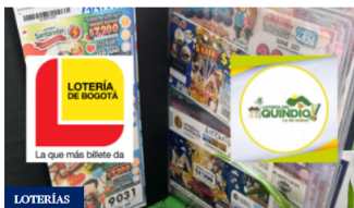
Lotería de Bogotá y Quindío último sorteo: resultados HOY 27 de noviembre 2025