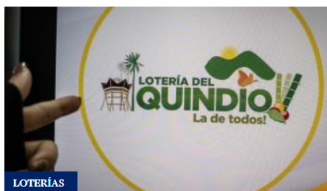
Resultados de la Lotería del Quindío hoy jueves 27 de noviembre