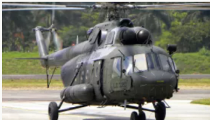
Mindefensa impone millonaria multa a contratista por fallas en mantenimiento de helicópteros MI-17