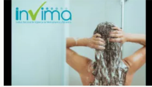
Invima ordena retirar del mercado alisador capilar por alteración química en su fórmula