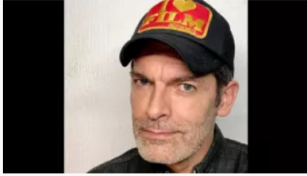
Luto en la pantalla: fallece el actor colombiano Conrado Osorio