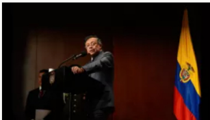
"No hay un solo peso del narcotráfico en mi campaña", presidente Petro