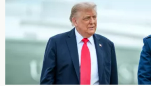
Trump anuncia acciones terrestres contra narcotráfico venezolano