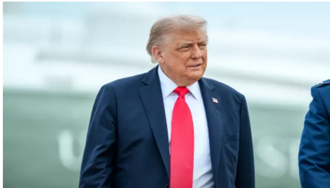
Trump anuncia acciones terrestres contra narcotráfico venezolano