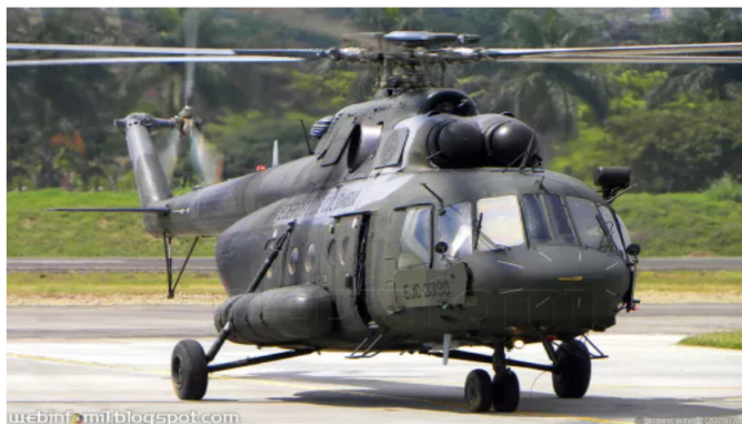
Mindefensa impone millonaria multa a contratista por fallas en mantenimiento de helicópteros MI-17