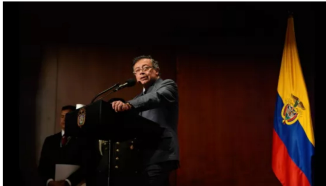
"No hay un solo peso del narcotráfico en mi campaña", presidente Petro