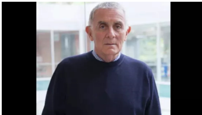
Exdirectivo de Ecopetrol denuncia posible uso de la UIAF para investigar a exempleados