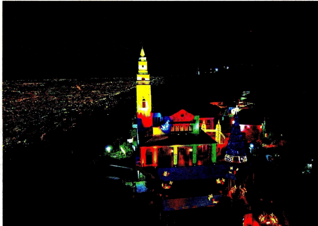
Desde hoy, uno de los sitios más emblemáticos de Bogotá se ilumina para recibir la temporada navideña. Monseratte inaugura su alumbrado (foto) con estaciones inspiradas en 11 países, entre ellas la de 'Colombia: un santuario de luz'. El recorrido invita a la reflexión y la diversidad cultural y estará habilitado todos los días hasta el 12 de enero, de 5:30 a 11:59 p. m. Bogotá / 1.20