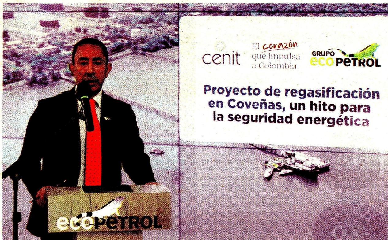
Ricardo Roa, presidente de Ecopetrol, está ahora en el ojo del huracán porque se prevé una investigación penal forma.

En el documento entregado por el CNE se resolvió