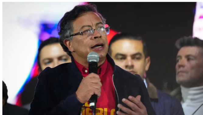
El mandatario colombiano sostuvo que es necesario que Colombia se centre en proyectos que impulsen la transición energética. Redes sociales

Le puede interesar: Grupo Ecopetrol revela cuánto está invirtiendo para transportar el gas que llegue a Coveñas