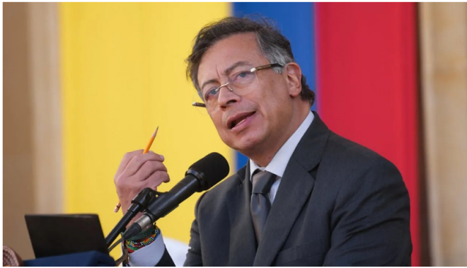
Petro planteó la necesidad de revisar la inversión de Ecopetrol en Estados Unidos.

Petro señaló que la infraestructura en las zonas de Texas y Delaware donde se ubican varias plataformas operadas por Ecopetrol y Oxy no permite aprovechar plenamente ese gas. En muchos casos, debido a su bajo precio en el mercado estadounidense, termina quemándose. “Hoy está en dos dólares el millón de BTU, lo cual es prácticamente nada”, aseguró.