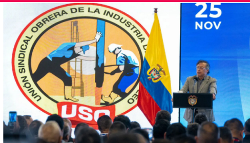
Petro, durante su discurso en el Plenario Sindical Nacional de la USO.

Durante su intervención en el Plenario Sindical Nacional de la Unión Sindical Obrera (USO), el presidente Gustavo Petro volvió a encender el debate sobre el futuro de Ecopetrol en Estados Unidos.