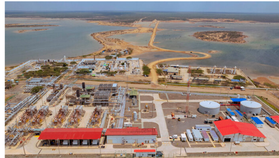
Campo Ballena, de la Asociación Hocol – Ecopetrol, en el municipio de Manaure, en La Guajira.

El Grupo Ecopetrol definió la ruta para garantizar el suministro de gas natural a más de 36 millones de colombianos durante la próxima década (2024-2034).