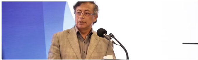
Gustavo Petro advierte sobre el riesgo de que Estados Unidos sancione a Ecopetrol y confisque sus activos en Permian sin compensación

Petro explicó que este procedimiento, que utiliza agua a presión para extraer los remanentes de hidrocarburos, degrada los pozos y genera rendimientos decrecientes.