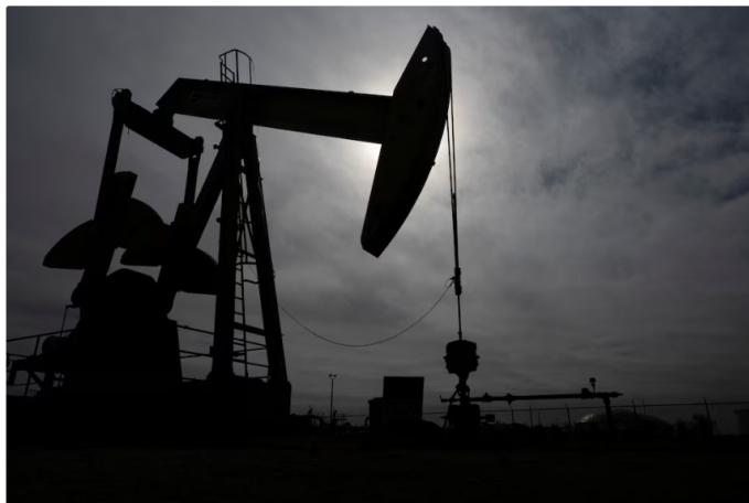
La infraestructura limitada en Texas y Delaware obliga a quemar el gas extraído, reduciendo su valor comercial para Ecopetrol

Aunque los informes empresariales presentan la producción bajo el concepto de "petróleo equivalente", sumando el aporte energético del gas y los líquidos, la rentabilidad real del campo estaría en declive. Petro advirtió que "cada vez hay que abrir más pozos para sacar el mismo volumen. Cada vez sale más gas, que vale menos. Es menos rentable", en referencia a la dinámica operativa que enfrenta Ecopetrol en Permian.