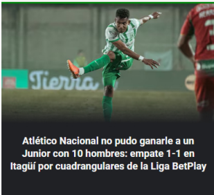
Atlético Nacional no pudo ganarle a un Junior con 10 hombres: empate 1-1 en Itagüí por cuadrangulares de la Liga BetPlay

Alarma en Puerto Gaitán, Meta, por amenazas de muerte a líderes comunales: grupo guerrillero estaría detrás del hostigamiento