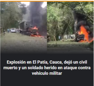
Explosión en El Patía, Cauca, dejó un civil muerto y un soldado herido en ataque contra vehículo militar