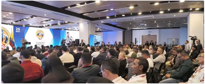
La inversión de Ecopetrol en Permian, que supera los 1.500 millones de dólares, no podrá recuperarse según el presidente Petro

petróleo. Y ustedes como trabajadores tienen que entender esto antes de que los emprenda la vida”.