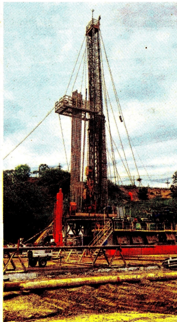
Hace cinco años se realizaron pruebas de 'fracking'.

Las reservas de petróleo en Colombia registraron una leve alza, pasaron de 2.020 millones de barriles de petróleo en 2023 a 2.035 millones de barriles de petróleo en 2024. De acuerdo con la entidad, Colombia repuso en 105% lo producido.