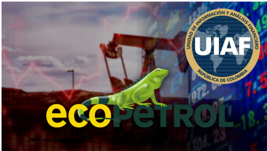
Ecopetrol y la UIAF.

La Procuraduría delegada para la Vigilancia Administrativa ordenó abrir una indagación previa a funcionarios por determinar de Ecopetrol y de la Unidad de Información y Análisis Financiero, por las irregularidades que se habrían presentado en el rastreo de información a empleados vinculados a la estatal petrolera.