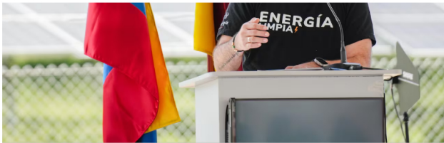
Edwin Palma, ministro de Minas.

El ente de control detalló que en las denuncias se fijó que dichas consultas habrían sido tramitadas sin orden judicial y sin algún tipo de notificación previa a las personas que les fue solicitada la información, entre ellos, al ministro de Minas y Energías, Edwin Palma.