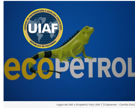
Logos de UIAF y Ecopetrol.

Se habría entregado información sensible de los miembros de la junta directiva de Ecopetrol.