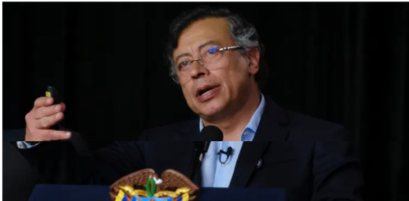
Gustavo Petro.

La alerta la hizo ante los dirigentes sindicales de la USO, el principal sindicato de Ecopetrol.