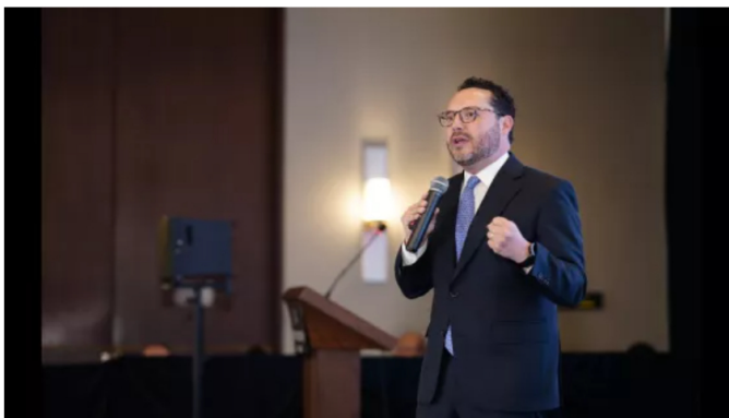
Solo uno de cada cuatro trabajadores en Colombia logra pensionarse, alerta Asofondos