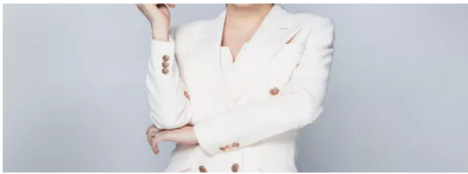
Orden de arresto contra Anne Jakrajutatip, copropietaria de Miss Universo, por presunto fraude millonario