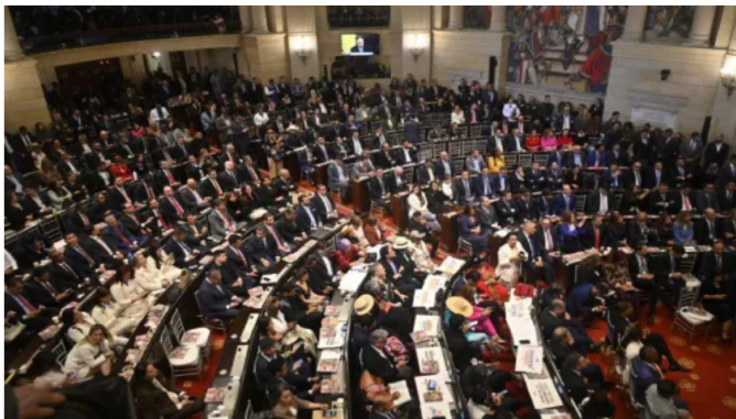
Discusión de la reforma tributaria se dará este miércoles