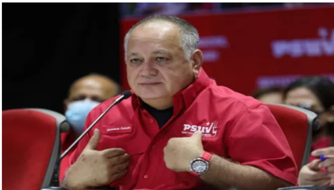
Diosdado Cabello advierte que quien intervenga en Venezuela será “aniquilado”