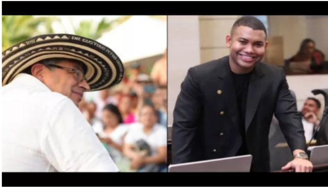
Sin acuerdo: Gustavo Petro y Miguel Polo Polo no conciliaron en la Corte Suprema