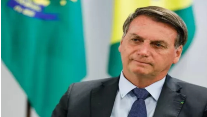
Defensa de Jair Bolsonaro presentará nuevo recurso tras quedar en firme condena por intento de golpe de Estado