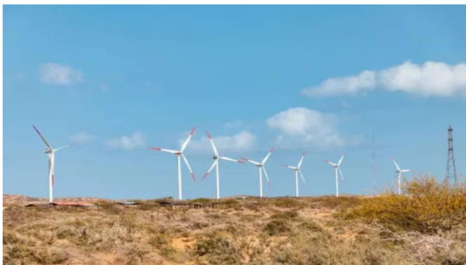
Windpeshi avanza en más del 90% en acuerdos de consulta previa con comunidades Wayuu en La Guajira