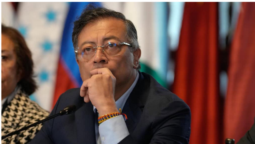
Gustavo Petro, presidente de la República.

Por: Manuel Alejandro Correa - 2025-11-24