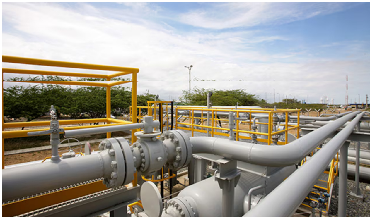
Campo Ballena en la Guajira

A los problemas que hay en Colombia con el déficit de gas se suma además el efecto de la situación de orden público, que, entre otras, ha impactado la producción en un importante punto del departamento de la Guajira donde se produce el combustible.