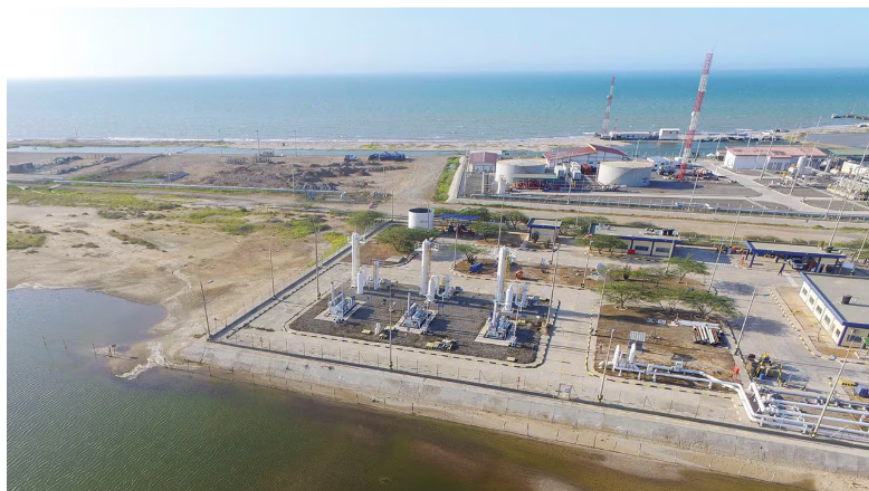
Infraestructura de Ballena, en La Guajira.

Según Hocol, el reclamo de la comunidad que adelanta los bloqueos, que es la de Carrapiñapule, nada tiene que ver con la industria extractiva. Está relacionado con circunstancias históricas del Estado colombiano (Ministerio del Interior, Gobernación de La Guajira y Alcaldía de Manaure) en materia de agua potable, educación, transporte escolar y reconocimiento de autoridades tradicionales.