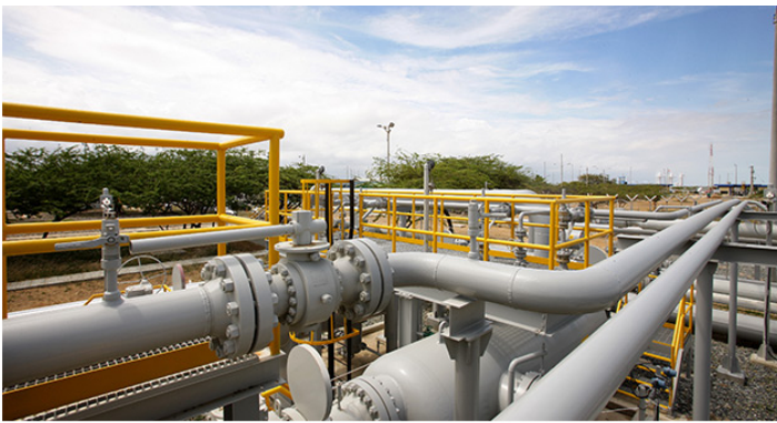
El complejo Ballena se encuentra bloqueado por indígenas wayuu.