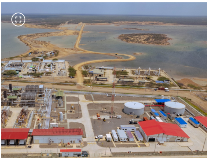
Complejo Ballena de Hocol.

Los retos que debe superar Colombia para evitar que naufrague el primer parque eólico marino de América Latina y se repita la historia de La Guajira