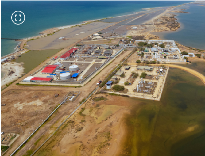
Complejo Ballena de Hocol.

Entrevista | Petróleos revela los planes que tiene en Colombia más allá de Sirius: está perforando un nuevo pozo con Ecopetrol en el mar Caribe