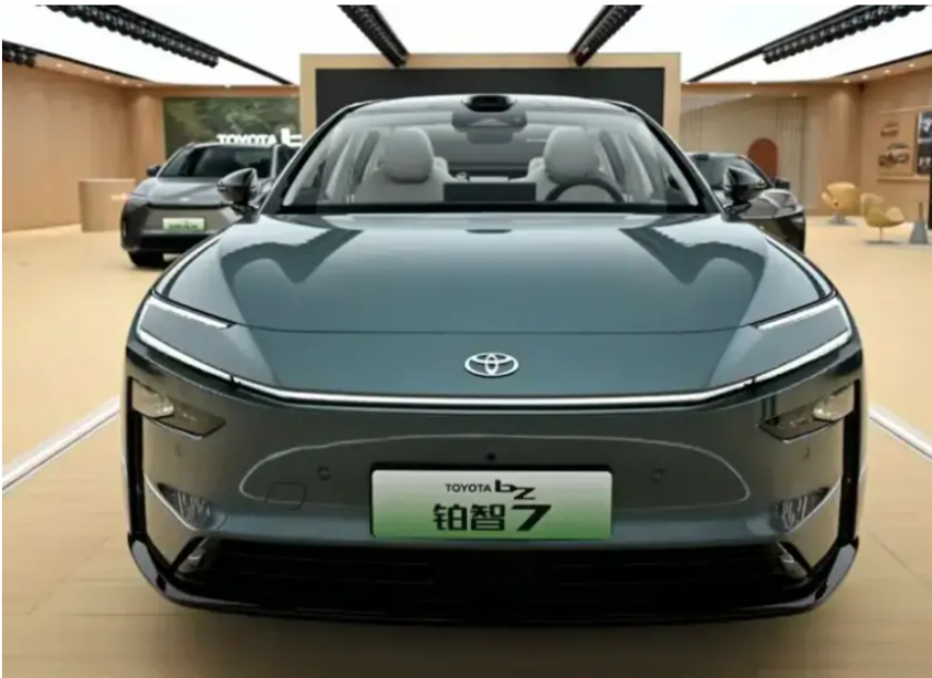
El Toyota bZ7 integra HarmonyOS y un sensor LiDAR, además de ofrecer hasta 710 km de autonomía.

En plena presión por la llegada de nuevos competidores, Toyota lanzó el bZ7 en el Auto Guangzhou 2025, un sedán de gran tamaño desarrollado en China y equipado con tecnología de Huawei. La marca busca recuperar terreno en el mercado eléctrico más competitivo del mundo.