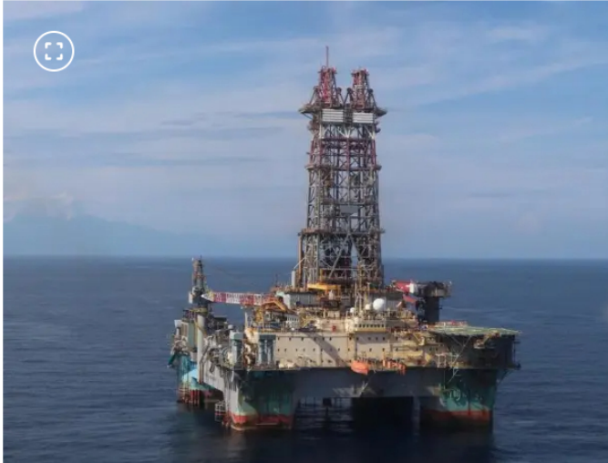
El proyecto Sirius le entregaría al país cerca de seis terapiés cúbicos de energía.

Todo es discutido internamente. Nada se decide sin la casa matriz. Todo es discutido con el board y el consejo de la casa matriz.