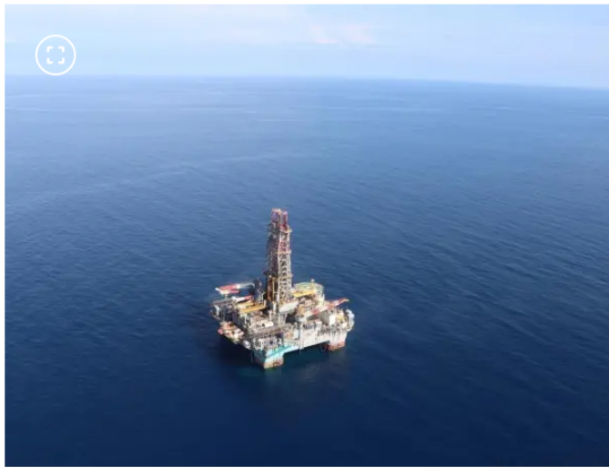
El proyecto Sirius le entregaría al país cerca de seis terapiés cúbicos de energía.

una respuesta de la ENHSA, pero es un trabajo conjunto.