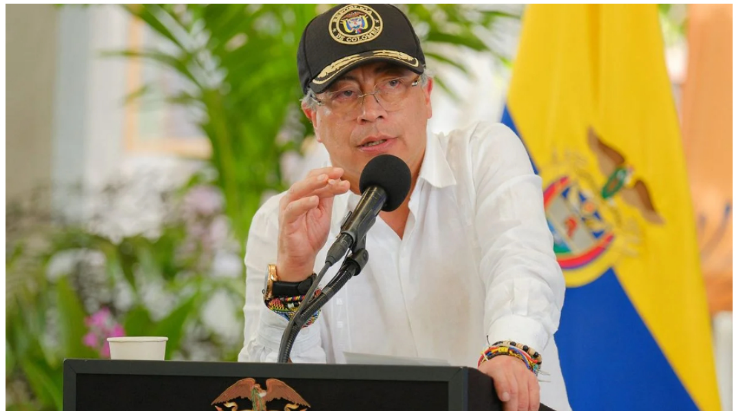
Gustavo Petro se pronunció sobre una eventual invasión militar de Estados Unidos en Venezuela.

A través de un mensaje publicado en su cuenta de X , el presidente Gustavo Petro se pronunció sobre una eventual invasión militar de Estados Unidos en Venezuela y alertó sobre las consecuencias económicas y humanitarias que, según él, tendría ese escenario para Colombia .