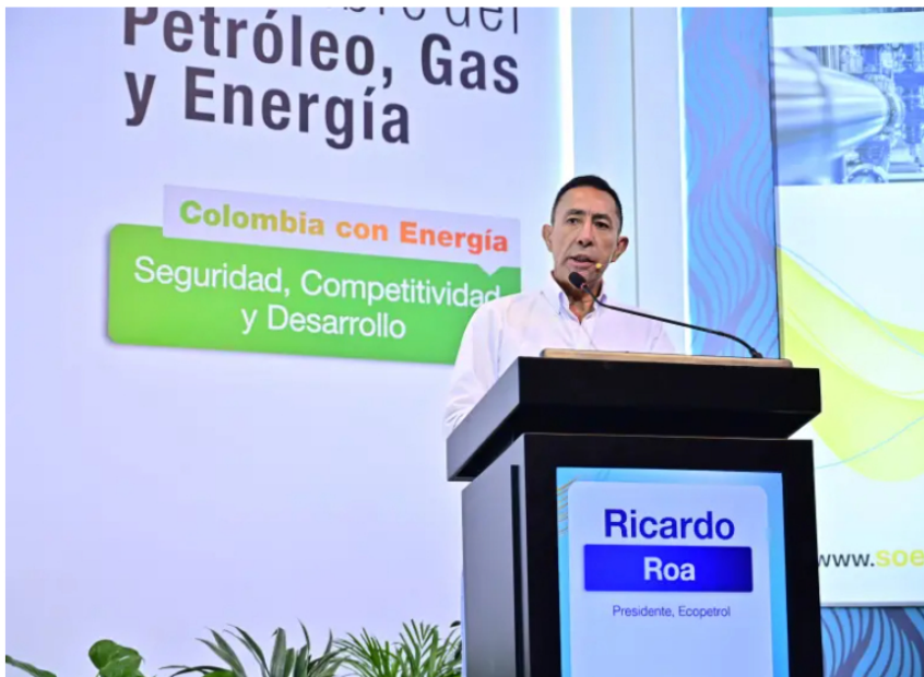
Ricardo Roa, presidente de Ecopetrol .

Ricardo Roa, presidente de Ecopetrol , anunció inversiones por más de US$170 millones en proyectos de transporte, un segmento que, dijo, buscará fortalecer tanto en Colombia como en el exterior.